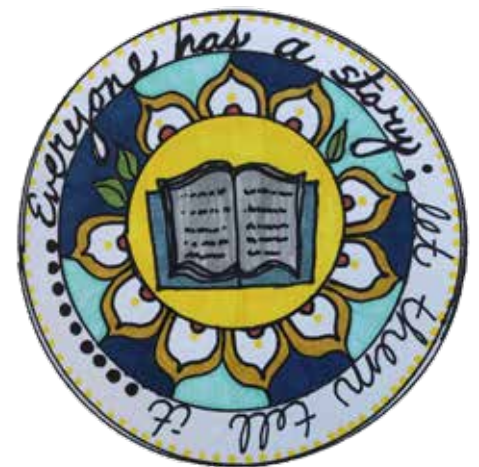
[ŒUVRE DE SANDY]